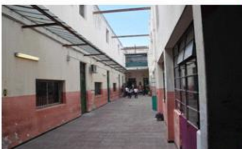
Antes y después