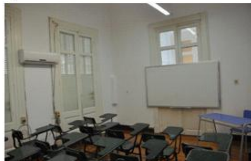
Liceo No. 21 de Montevideo