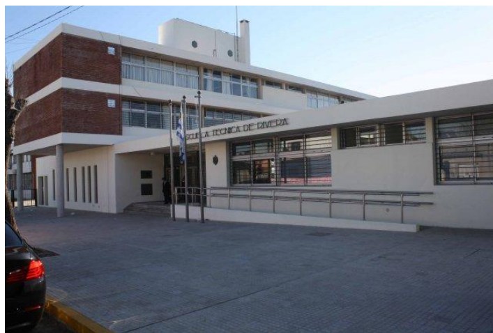
Escuela Técnica (UTU) de Rivera