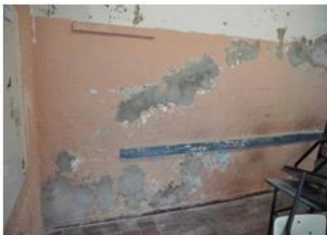
Antes y después

Más del 76 % de las obras de mantenimiento se realizaron en centros educativos del interior del país