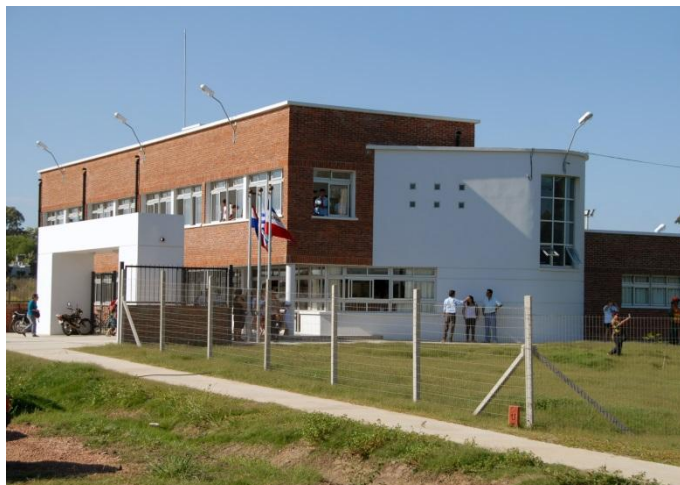
Liceo de Tiempo Completo en San Luis, Canelones