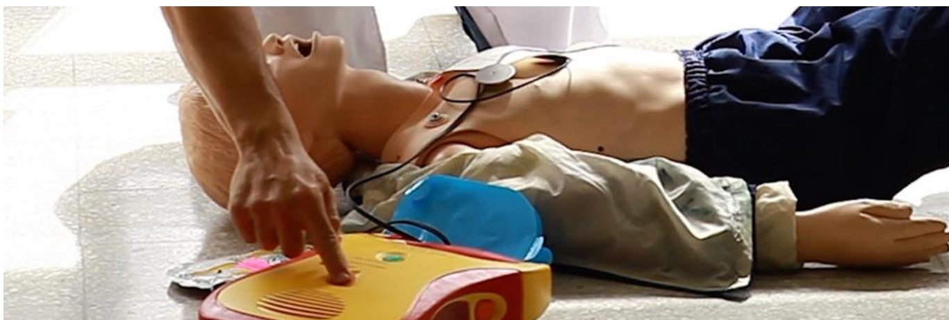
Figura 7. Desfibrilador externo automático.

En Uruguay desde el año 2009 se promulgó la ley N° 18.360 que refiere la obligatoriedad de disponer de un DEA en espacios públicos o privados donde exista afluencia de público. (7)