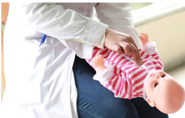
Figura 10: Posición boca arriba.