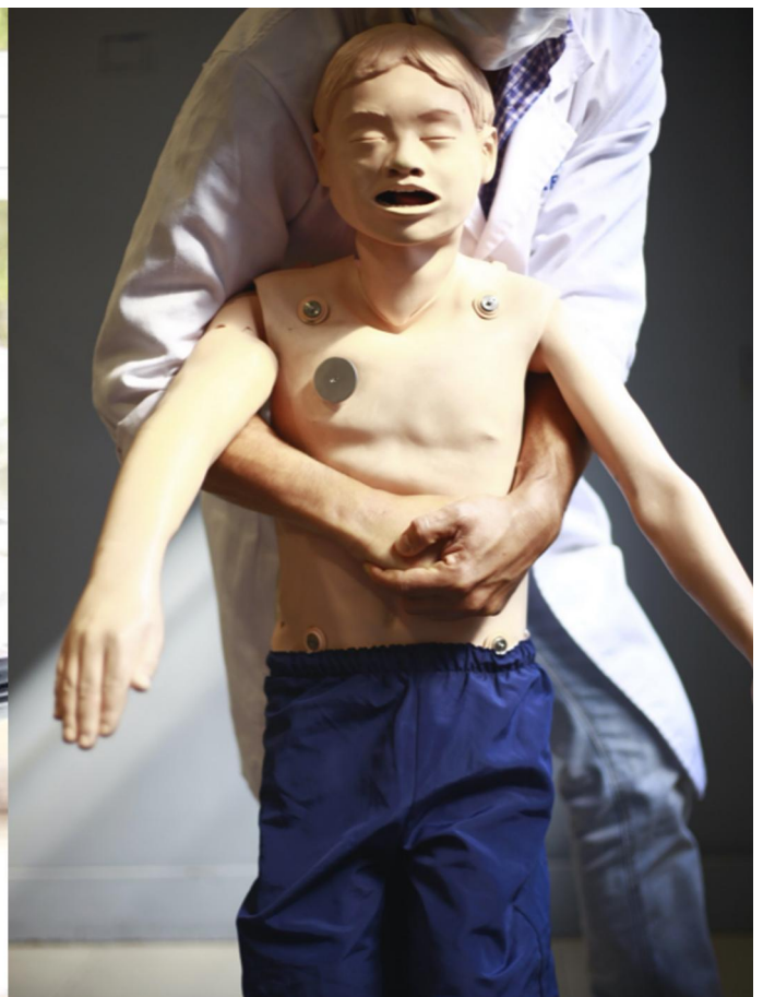
Figura 12: Posición de pie en niños grandes.