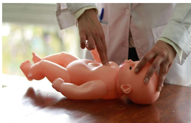
Figura 2. Masaje cardíaco en recién nacidos y lactantes.