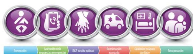
Figura 1. Cadena de supervivencia del RCP pediátrico. Aspectos destacados de las guías de la American Heart Association del 2020 para RCP.

Estas medidas forman parte de la llamada cadena de supervivencia (figura 1) de lactantes y niños, que incluye acciones salvadoras dirigidas a reducir el número de muertes y es diferente a la del adulto. Cada eslabón de la cadena debe ponerse en práctica lo antes posible para aumentar la sobrevivencia (2-6) .