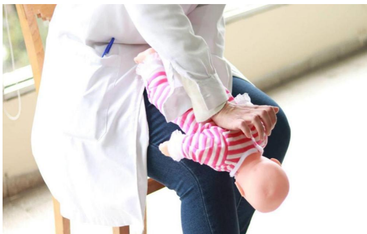
Figura 9: Posición “boca abajo”.