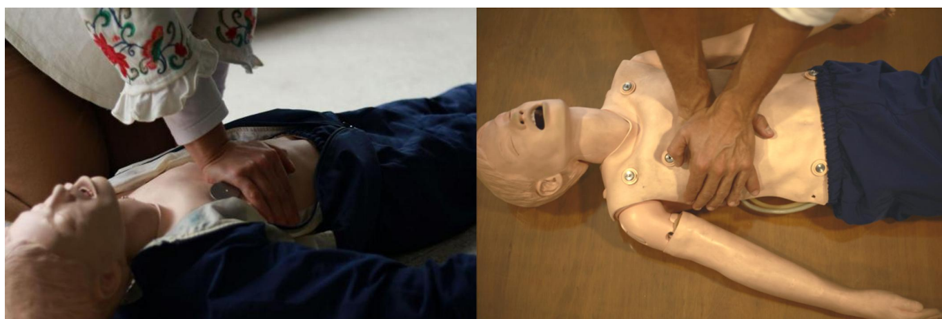
Figura 5. Masaje cardíaco en niños y adolescentes. En A (figura izquierda) se observa el masaje cardíaco con una sola mano. En B (figura derecha) se observa la misma maniobra con 2 manos, recomendada para mayores de 8 años.