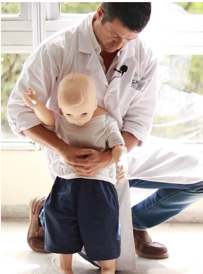
Figura 11: Posición agachado en niños pequeños.