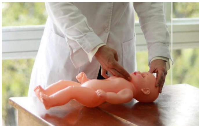
Figura 3. Posición para la respiración artificial